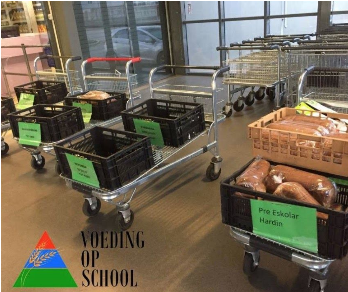
Foto: Ontbijtpakketten staan iedere morgen om 6.30 uur klaar bij Pietersz Distribution.